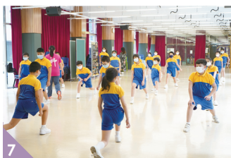
6&7. 學校堅持在安全情況下維持體藝課堂，發展學生多元智能。 8. 學校的手鈴隊曾獲邀到香港國際機場演奏聖誕樂章，為不同地方的來港旅客增添節日歡樂。 9. 花式跳繩隊參加全港分區跳繩比賽，學生展現精湛的技巧。 10. 學生經過刻苦的獅藝訓練後，學有所成，一頭頭雄獅活靈活現。 11. 學校帶領學生衝出香港，參加上海 WER 世界教育機器人大賽，見識他山之石後，學生變得更積極主動。