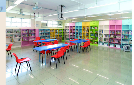
新校舍的課室較寬敞，更方便不同教學用途