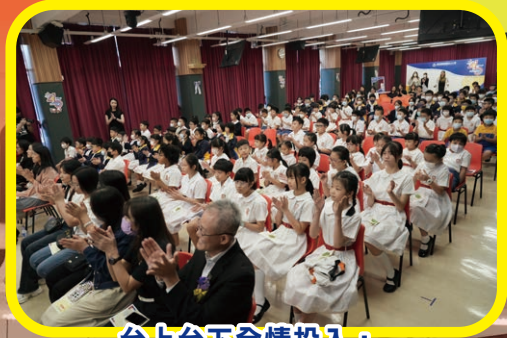
台上台下全情投入，熱烈氣氛洋溢整個校園