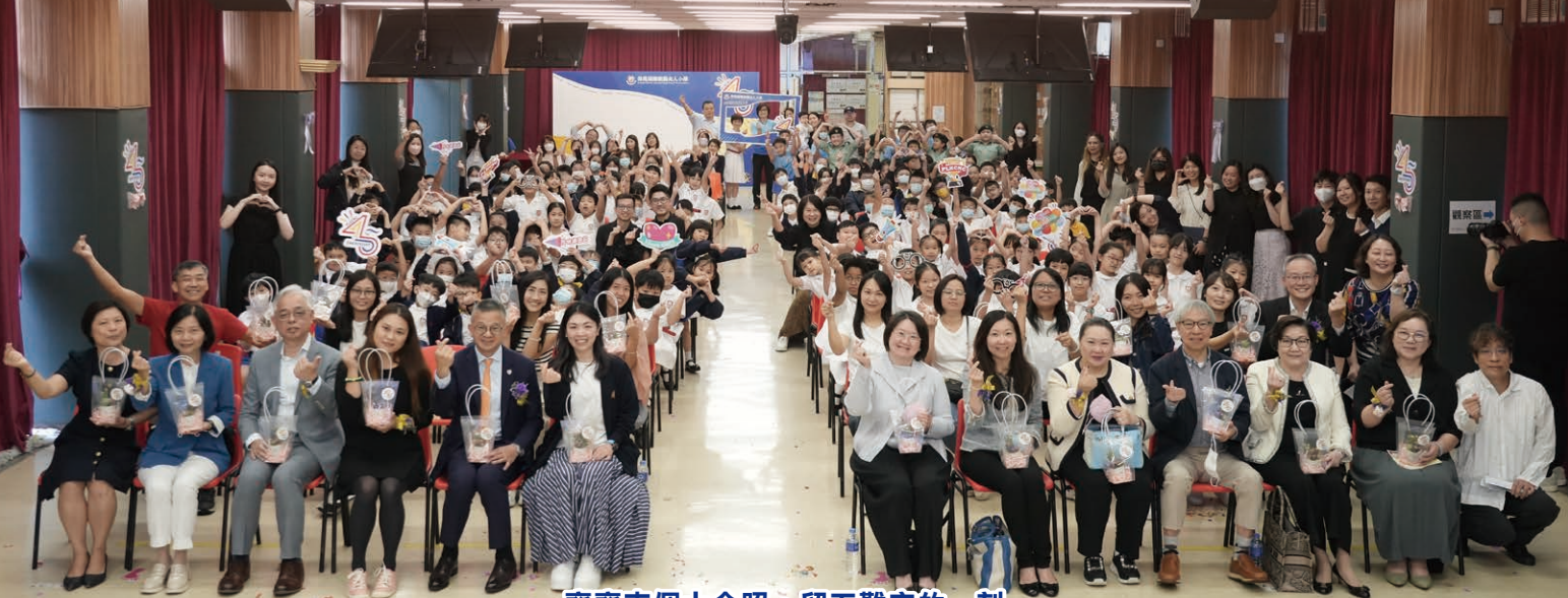
齊齊來個大合照，留下難忘的一刻