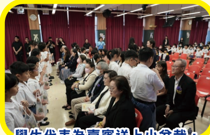
學生代表為嘉賓送上小盆栽，表達謝意

我們的學生能茁壯成長。最後，全場一同參與大合唱歌曲「LOVE」作為壓軸環節。全校師生、家長、校友上下一心，並肩同行，共同為「陳南昌」之將來迎來更光輝一頁。