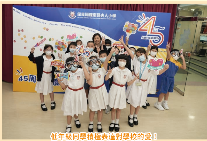
低年級同學積極表達對學校的愛！