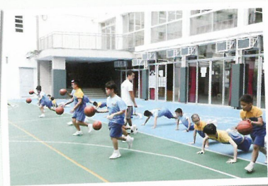
一邊練習運球，一邊訓練體能。