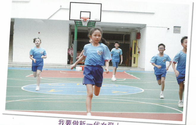
我要做新一代女飛人。