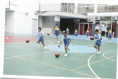
大家比試一下運球的速度，好玩極了。