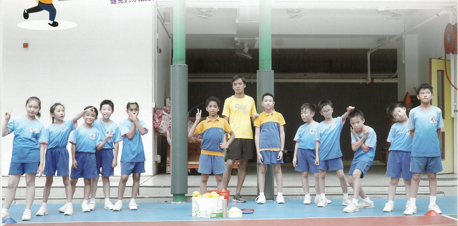
田徑訓練後拍照，學生展現扮鬼扮馬的本色。