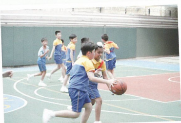
同學最期待的分組比賽，好刺激啊！