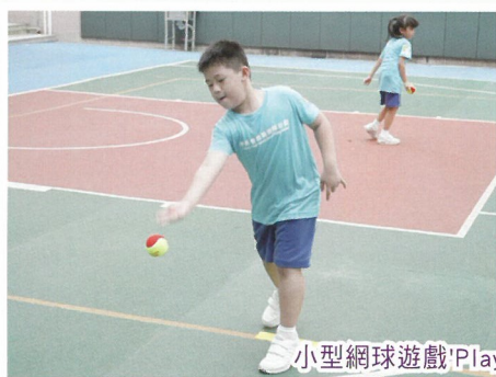
小型網球遊戲'Play and Stay'