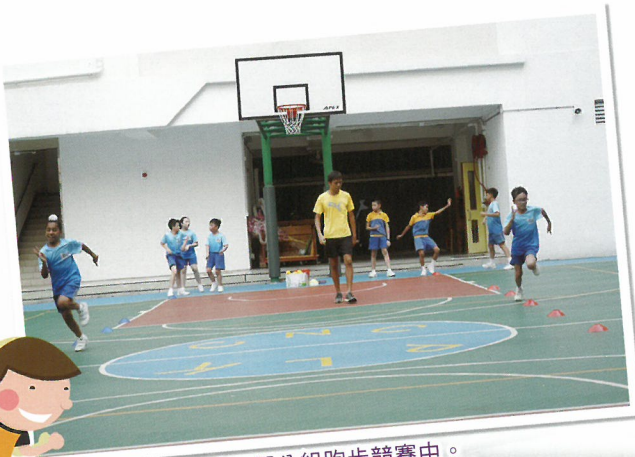
健兒們分組跑步競賽中。