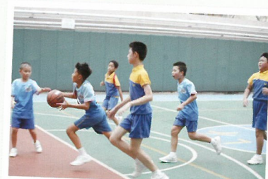
同學在比賽中勇往直前，勢不可擋。