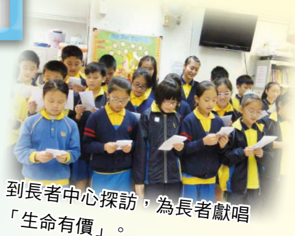
到長者中心探訪，為長者獻唱「生命有價」。

「關愛小天使」義工培訓計劃主要招募小四至小六學生為關愛小天使，進行義工培訓活動，讓他們學習做義工應有的態度及多關心身邊有需要的人。在此計劃下，校方同時為其他學生提供不同社會服務經驗，以鼓勵全校性關愛文化。活動包括「義工培訓工作坊」、「義工培訓營」、「社區攤位教育日」、「關愛服務日」及「關愛探訪日」，參與學生均表示能夠幫助社區及長者，感到快樂及有意義。