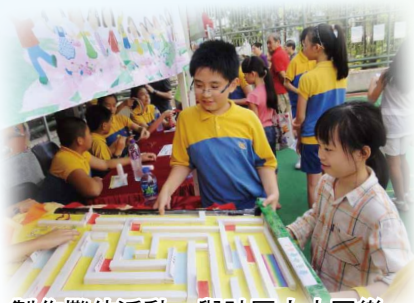
製作攤位活動，與社區人士同樂。