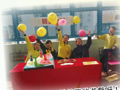
這是我們一起設計的攤位遊戲呀!