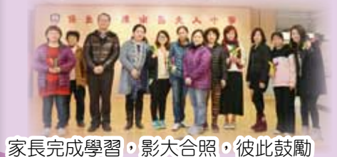
家長完成學習，影大合照，彼此鼓勵