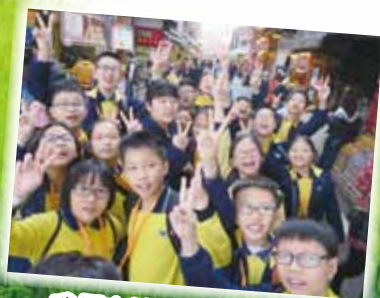
我們在淡水老街有豐富的收穫。