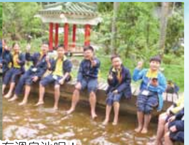
湖山國小的主任耐心地教導我們認識當地的生態環境，那兒設有樹屋，還有溫泉池呢！同學們都在學校中學會「藍染」。