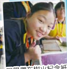
同學們在樹火紀念紙博物館內一起製作再造紙。