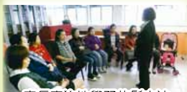
家長專注地學習放鬆方法