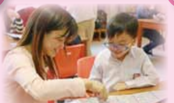
家長與同學共同製作魔術工具