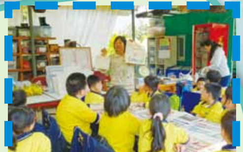
「花花世界有機農莊一日遊」