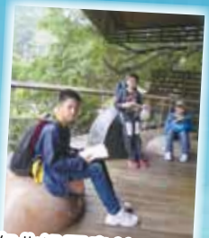
在北投圖書館內閱讀真是別有一番滋味。