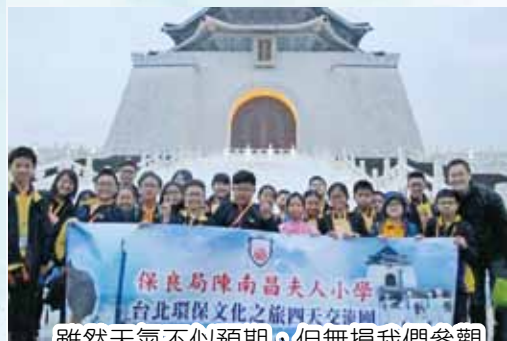
雖然天氣不似預期，但無損我們參觀中正紀念堂的心情。