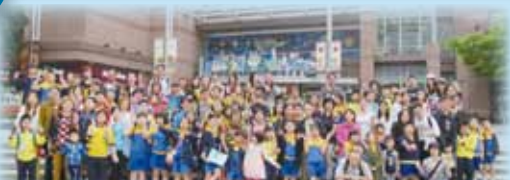
「一、二、三！YEAH！」師生家長出發遊覽