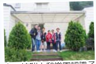
在三峽中和樂園認識了「碳中和」的概念，並參觀了特色的綠能樹屋。