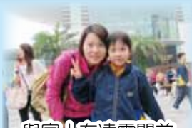
與家人在凌霄閣前留倩影