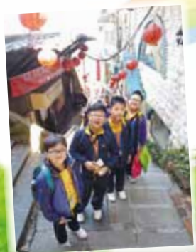
九份的窄巷果然充滿懷舊氣息。