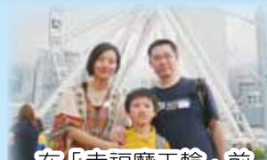
在「幸福摩天輪」前合照，好 SWEET！