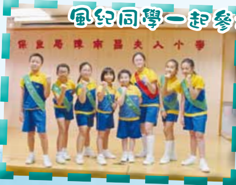
風紀同學一起參加終真領袖訓練計劃