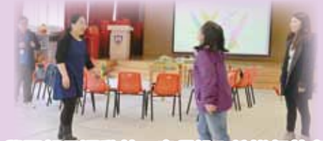
學習親子運動前，家長投入地進行熱身