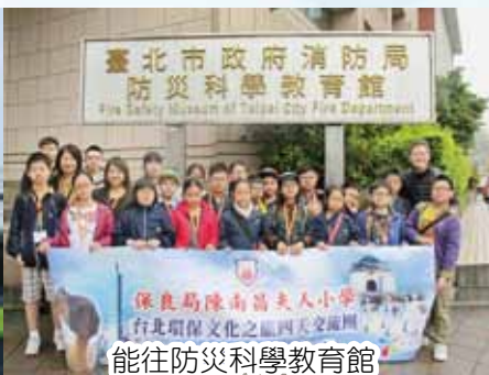
能往防災科學教育館參觀真是不枉此行。