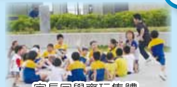
家長同學齊玩集體遊戲，歡渡時光！