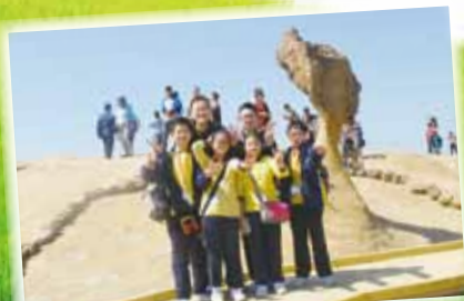
實地考察野柳地質公園，大家終於能與「女皇頭」合照了。