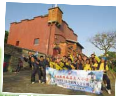
淡水紅毛城是具特色的一級古蹟。