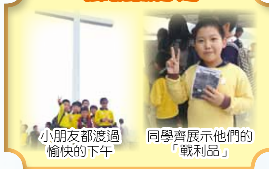
小朋友都渡過愉快的下午