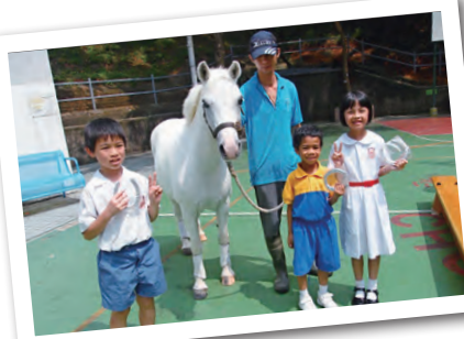
同學們積極提問及回答問題，還得到小禮物。