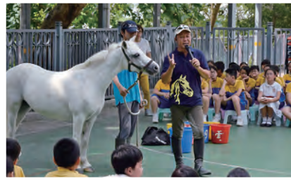
本校於 10 月 2 日帶小馬入彩雲邨，讓學生親身學習有關馬兒生活的習慣及知識。