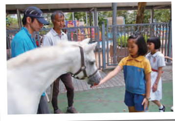
同學們更可以零距離接觸小馬，他們可以餵飼馬公主。