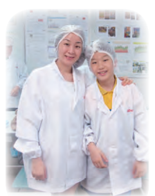
準備好了！出發參觀廠房。