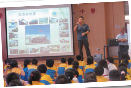
徵教署職員到校介紹有關徵教署的職務。