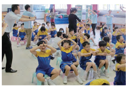
香港理工大學護理系學生到校介紹正確使用電腦的姿勢，讓學生關注健康。