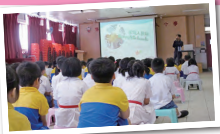
學生專心聆聽導師介紹有關馬兒的知識，初步理解馬兒的生活習慣。