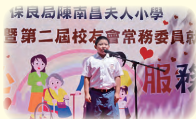
精彩表演一浪接一浪