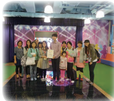
在舞台上影大合照，感覺很不同！家長都很滿意 PLAYHOUSE 的地方。