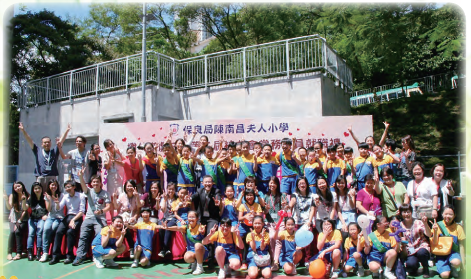
陣容強大的陳南昌團隊